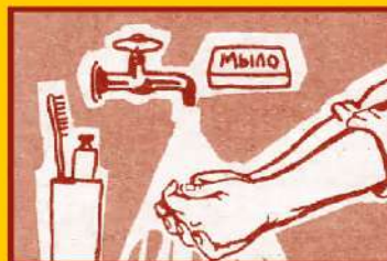
Регулярно мойте руки