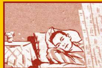
Избегайте контактов с заболевшими