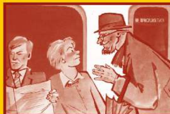
Ограничьте пребывание в местах скопления людей